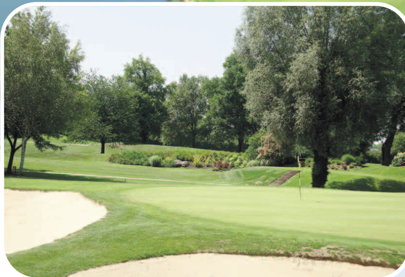
Le parcours jaune de Illkirch