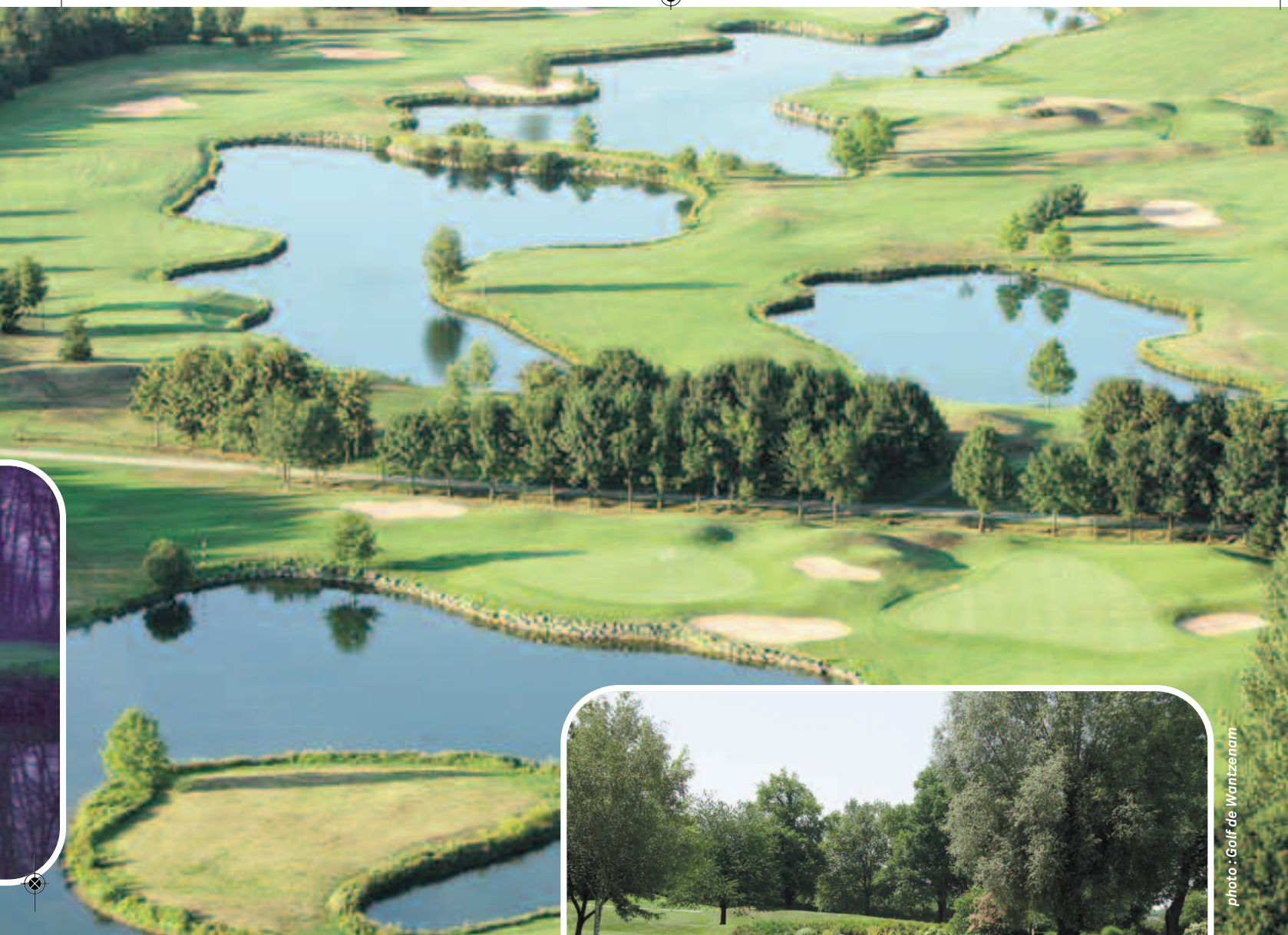
Vue aérienne du golf de la Wantzenau

la cuisine qui est servie en terrasse est absolument délicieuse. De nombreux hôtels partenaires de la région proposent des packages green fees inclus. ( www.golf-wantzenau.fr/hotels_partenaires.php )